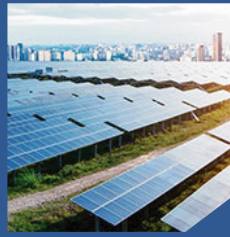
ÉNERGIE & MINES