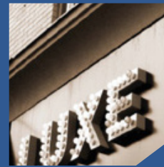
INDUSTRIES DU LUXE